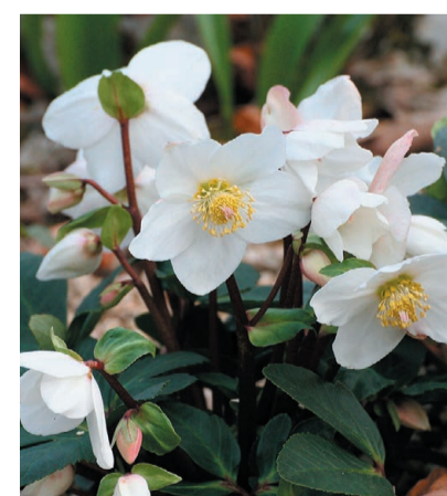
Christrose (auch im Bibelgarten)

Infolge der aktuellen Corona-Situation wird die offizielle Verabschiedung von Margreth zu einem späteren Zeitpunkt erfolgen, voraussichtlich in einem Sommergottesdienst mit einem Apéro im Bibelgarten.